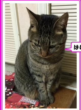
はじめまして 川越トラと申します

池口正和 1995年、現像所で働きながら、ストリート写真を撮り始める。2005年、猫の魅力に取りつかれ、九州の島猫を撮影開始。2008年、東京の猫を撮りたい思いがつのり、上京。人物、猫撮影を中心に、雑誌、展覧会など、精力的に活動中。