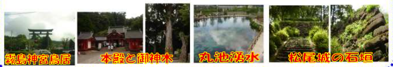
霧島神宮鳥居 本殿と御神木 丸池湧水 松尾城の石垣