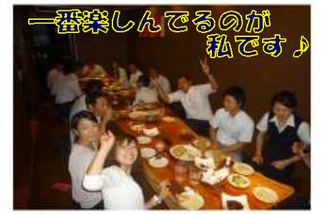
一番楽しんでるのが私です♪