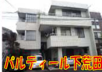
パルティール下荒田