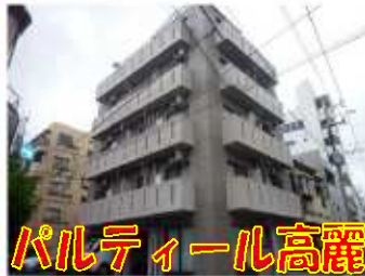
パルティール高麗